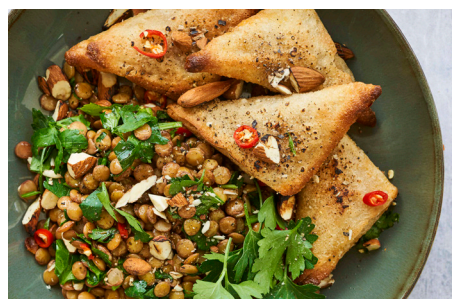
Mini Samosas m. grøntsager, 4 x 30x30g, æske varenr.: 151700 Vegansk