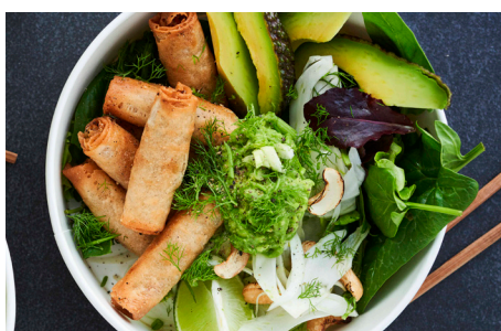
Mini Van Choy m. oksekød, 8 x 24x25g, æske varenr.: 800789