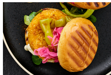
Vegetarisk Nachobøf, 1 x 24x100g, pose varenr.: 152010 Vegetarisk