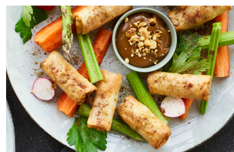
Mini Van Choy m. grøntsager, 8 x 24x25g, æske varenr.: 800790 Vegansk