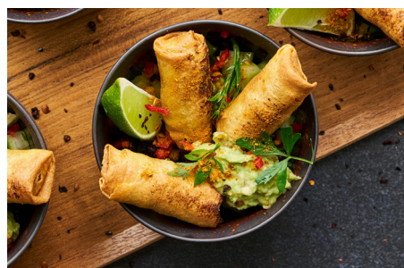
Mini Burritos m. tex-mex oksekød fyld, 8 x 24x25g, æske varenr.: 800791