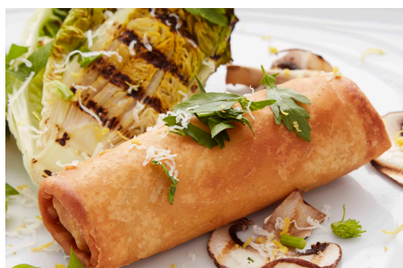
Classic Forårsruller, 8 x 8x100g, pose varenr.: 800901