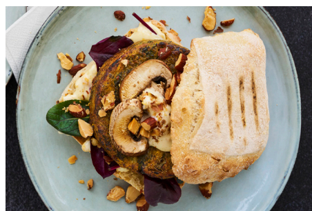
Falafel Spinat bøf, 1 x 24x113g, pose varenr.: 152070 Vegansk