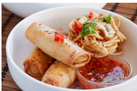
Classic minirulle, 10 x 40x25g, pose varenr.: 800819