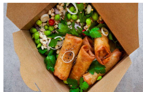
Øko. Minirulle, 8 x 24x25g, æske varenr.: 800802 Vegansk