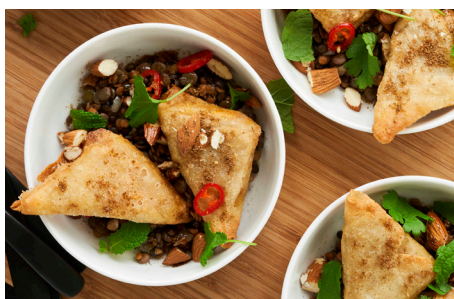
Mini Samosas m. chicken tikka fyld, 4 x 30x30g, æske varenr.: 151680