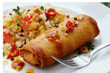
China Maxi Fastfood, kæmpe rulle, 6 x 10x150g, pose varenr.: 810194