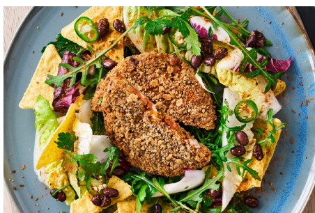
Spicy Bean bøf, 1 x 24x113g, pose varenr.: 152050 Vegansk